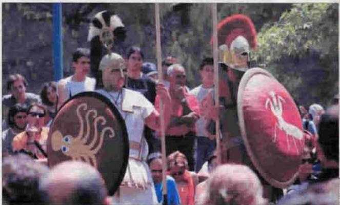
Tarraco más viva que nunca. Las jornadas de reconstrucción histórica Tarraco Viva van a más. Ayer pasaron por los diferentes escenarios personas llegadas de todos los rincones del Estado que, junto a los tarracomanos, colgaron el cartel de lleno total en todas las actividades. El ambiente, incluso, se quedó pegado para ver a los gladiadores. PÁGINA 18